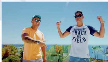
Kay One & Pietro Lombardi Senorita