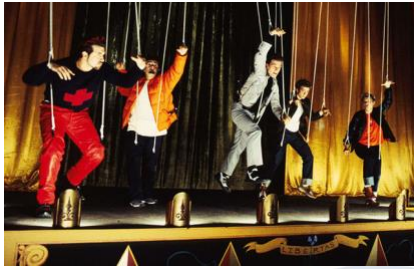
NSYNC. Bye bye bye.