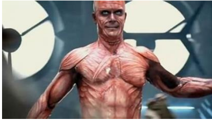
Robbie Williams. Rock Dj.