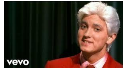
Eminem My name is