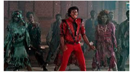
Michael Jackson Thriller