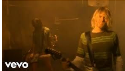
Nirvana. Smells like teen spirit