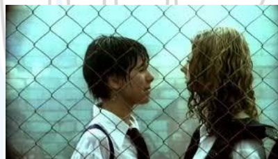
T.A.T.U. All the things she said.