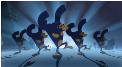
Gorillaz. Clint Eastwood.